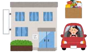
③老人福祉センターで受取り