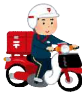
②引渡し日のお知らせ