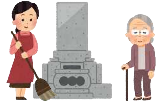
④パートナーがお手伝いします