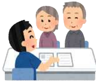
②職員が事前に打合せに伺います